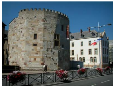
Tour aux Pucés -THIONVILLE