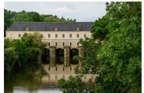
Pont de l'Ecluse YUTZ

Thionville , deuxième ville du département de la Moselle, se trouve culturellement en Lorraine et plus précisément en pays thionvillois, au nord du sillon mosellan. Cette ancienne ville au milieu du bassin sidérurgique tire par ailleurs profit de sa proximité avec le grand-duché de Luxembourg. Mentionnée pour la première fois en 753 dans une chronique, cette cité devenue lotharingienne en 855 où séjourne plusieurs fois Charlemagne qui apprécie d'y venir chasser ; elle est rattachée successivement à la partie germanique de l'Empire de Charlemagne, puis au duché du Luxembourg au XVII e siècle, elle devient française, pour devenir allemande de 1871 à 1918 où elle est réintégrée à la France.